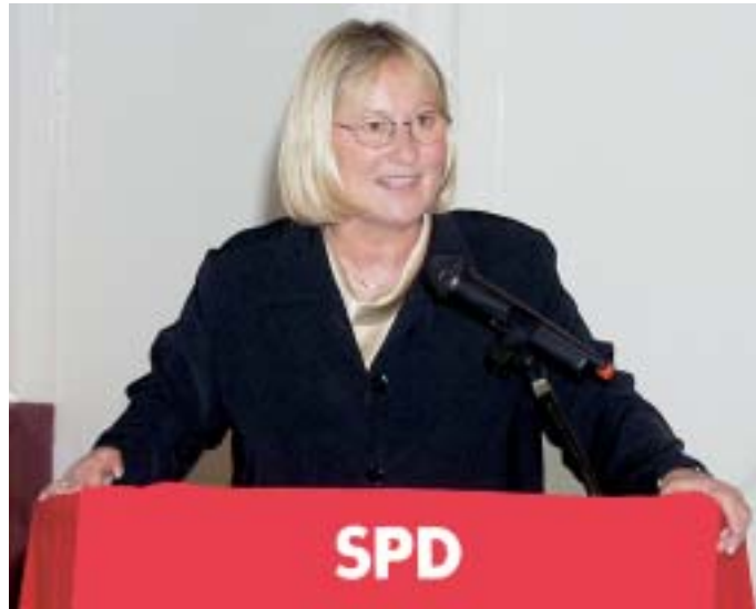
Dr. Brigitte Fronzek, stellvertretende Vorsitzende der SPD Schleswig-Holstein.

Um die Zustimmung der Menschen zu erlangen, werden die örtlichen Gliederungen der SPD glaubhafte Konzepte zur Verwirklichung einer familien- und kinderfreundlichen Kommune vorstellen: Wie können die Zukunftschancen der jungen Generation verbessert werden? Wie findet die immer größer werdende Zahl aktiver Senioren ihren Platz in der Mitte unserer Gesellschaft? Wie können wir helfen bei der Solidarität der Starken mit den Schwachen? Wie wollen wir