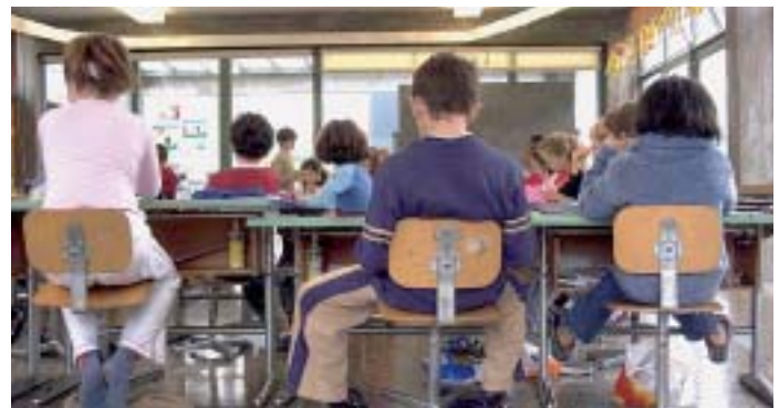
Kleine Klassen: Für den Lernerfolg gut, als demografische Folge schnell problematisch.

Der Rückgang der Kinder und Jugendlichen von 3 bis 20 Jahren wird sich unterschiedlich intensiv auswirken. So ist zum Beispiel in Kiel nur mit ca. 10 Prozent, im Kreis Dithmarschen hingegen mit 27 Prozent zu rechnen. Dies gilt auch für die demografische Prognose in den jeweiligen Altersstufen. Die Zahl der 6- bis 10-jährigen bleibt in Flensburg und Kiel stabil auf heutigem Niveau, geht aber in den Kreisen Plön und Dithmarschen um 30 Prozent zurück. Auch in den anderen Altersgruppen geht die demografische Schere weit auseinander: Bei den 10- bis 16-jährigen ist eine Abnahme zwischen 16 Prozent im Kreis Herzogtum-Lauenburg und 32 Prozent in Neumünster zu erwarten. Bei den 16- bis 20-jährigen wird eine leichte Zunahme im Kreis Stormarn, jedoch ein Verlust von 26 Prozent in Flensburg zu verzeichnen sein. Diese erstaunlich uneinheitlichen Zahlen spiegeln den Ist-Zustand wider und berücksichtigen auch die erwarteten Entwicklungen. So werden sich im Kreis Plön die „Kindergartenkinder“ bis 2020