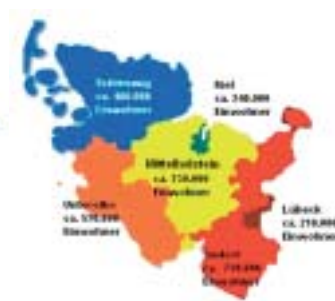
Gebietsreform auf einen Blick: Oben der heutige, rechts ein möglicher Zuschnitt