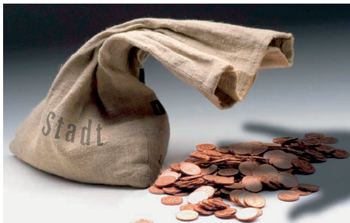
Kein Griff des Landes in das Stadtsäckel!

Die Arbeitsgruppe hat einmal getagt – dann nie wieder! Und die Kompensation, die auch der Koalitionspartner CDU zugesagt hatte, ist nur unzureichend eingetreten. Sie wird – nach der vom Koalitionsausschuss am 1. Oktober beschlossenen glanzlosen Beredigung der angestrebten Kreisgebietsreform – zumindest in der angepeilten Höhe – auch nicht mehr eintreten können. Im Ergebnis müsste daher – nach Beschlusslage der Koalitionspartner – der Eingriff der Jahre 2007