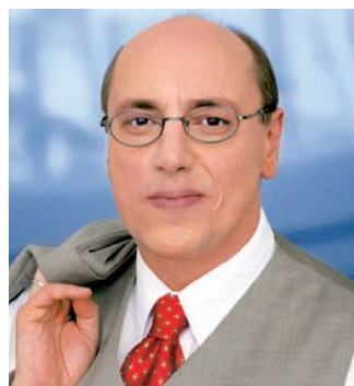
Kurt Bodewig war bis 2002 Bundesverkehrsminister.

höht. Hamburg bleibe damit auf den Mehrkosten sitzen. Um zusätzliches Geld für die geplante Hafenspanne zwischen den Autobahnen 1 und 7 vom Bund zu bekommen, schlug Bodewig vor, Sondermittel einzuwerben. „Hamburg hat mit dem Hafen eine Sonderfunktion für ganz Norddeutschland. Das muss der Bund honorieren und sollte die Länderquoten anrechnen.“