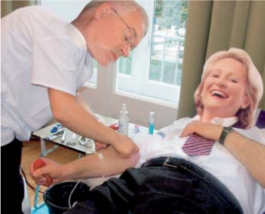
Wann der Kieler OB Volquartz das Lachen wohl vergeht?