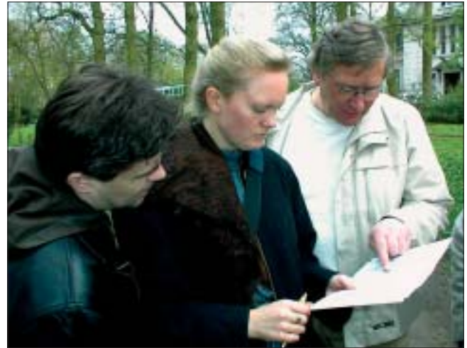
Frühzeitige Bürgerbeteiligung ist ein Element kommunaler Demokratie und sichert Akzeptanz von Entscheidungen

Die Zukunft der Stadt kann nur dann gestaltet werden, wenn sie vor Ort mit den kommunalpolitischen Gremien gemeinsam und nicht gegen sie entwickelt wird. Wir Sozialdemokratinnen und Sozialdemokraten werden darüber wachen, dass die Bezirksversammlungen, Stadtplanungs- und Regionalausschüsse auf der einen, aber auch Bürgerbeteiligung, Bürgerbegehren und Bürgerentscheid auf der anderen Seite, nicht unter die Räder kommen.