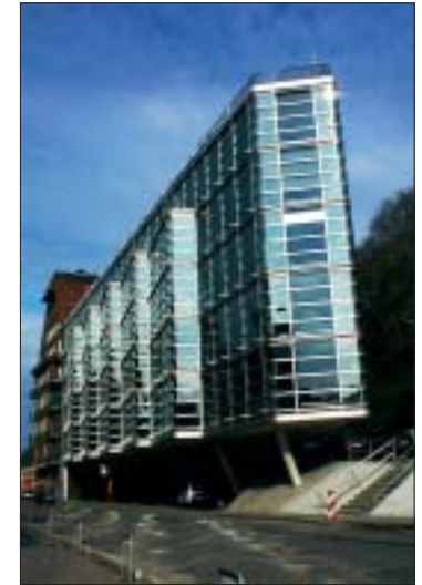
Die Revitalisierung ehemaliger Hafenflächen bietet Chancen für das Wachstum neuer Branchen

Dem können wir Sozialdemokratinnen und Sozialdemokraten uneingeschränkt zustimmen.