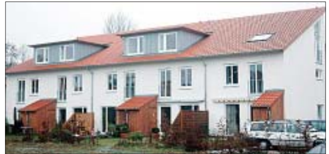
Reihenhausprojekte wie auf dem ehemaligen „Kleiderkammer“-Gelände in Flottbek werden in Hamburg stark nachgefragt. Die Grundstückskosten sind niedriger als bei Einzelhäusern.

Gleichzeitig wird die Lebensqualität einer Stadt und besonders der innerstädtischen Quartiere stark vom Ver-kehrsaufkommen und von Verkehrsbelastungen beein-flusst. Dies führt in der Praxis immer wieder zu Konf-likten, die im Einzelfall schwierige Abwägungsprozesse erfordern. Der neue Senat hat den Eindruck erweckt, er könne die Probleme des Individualverkehrs in der