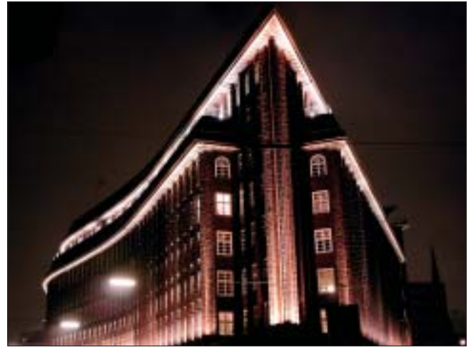
Viele europäische Metropolen setzen Licht im öffentlichen Raum ein, das auch zu mehr Sicherheit beiträgt. Hamburg hinkt noch hinterher.