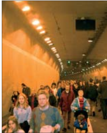
Grenzenlose Mobilität? Hamburg muss neue Antworten auf die Forderungen der mobilen Gesellschaft finden