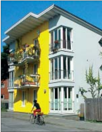
Architektur und Gebäudetypen müssen sich an veränderte Wohnbedürfnisse der Bevölkerung anpassen