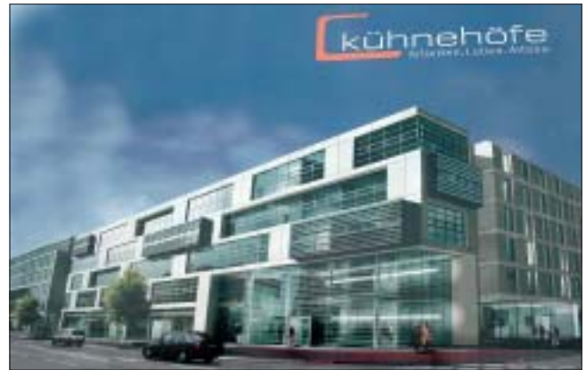
Beispiel für die neue Nutzung ehemaliger Industrieflächen für mittelständische Existenzgründer: ehemalige „Kühne“-Fläche

sen die in den Bezirken vorhandenen Kundenzentren weiter ausgebaut und durch eine zusätzliche Bündelung der Aufgaben Ansprechpartner für alle wesentlichen Anliegen der Bürger werden.