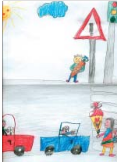
Die siebenjährige Nina wünscht sich mehr Sicherheit im Verkehr für Kinder.

Wohnen ist eine der zentralen Grundfunktionen des menschlichen Lebens. Die Wohn- und Wohnumfeldqualität entscheidet in hohem Maße über die Lebens-